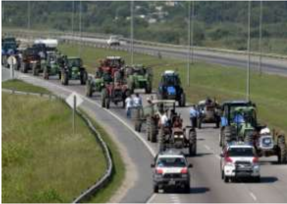
Imagen de archivo de una de las protestas de productores contra la política oficial hacia el sector. BUENOS AIRES (EFE). “El Gobierno exhibe (una cosecha de) 100 millones de toneladas como si fuese un logro propio, y nosotros podemos decir que hay 100 millones de toneladas a pesar de este gobierno”, dijo ayer en declaraciones radiales el presidente de la Federación Agraria Argentina (FAA), Eduardo Buzzi.

Buzzi recordó que los cuatro mayores gremios agrarios del país han convocado un paro debido a la negativa de la Presidenta de concederles una audiencia para expresarle sus reclamos.