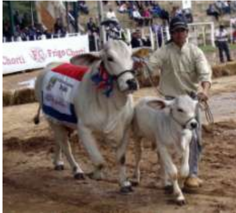
Más de 200 animales desfilaron, compitieron y fueron evaluados en la Expo Isla Po'i 2013.

CAMPO DE EXPOSICIÓN ISLA PO'I, Chaco (Marvin Duerksen, corresponsal). Ayer se inauguró la 29ª edición de la Expo Isla Po'i, con más de 200 animales, un récord para esta feria, que también contó con 60 stands industriales, comerciales y de servicios.